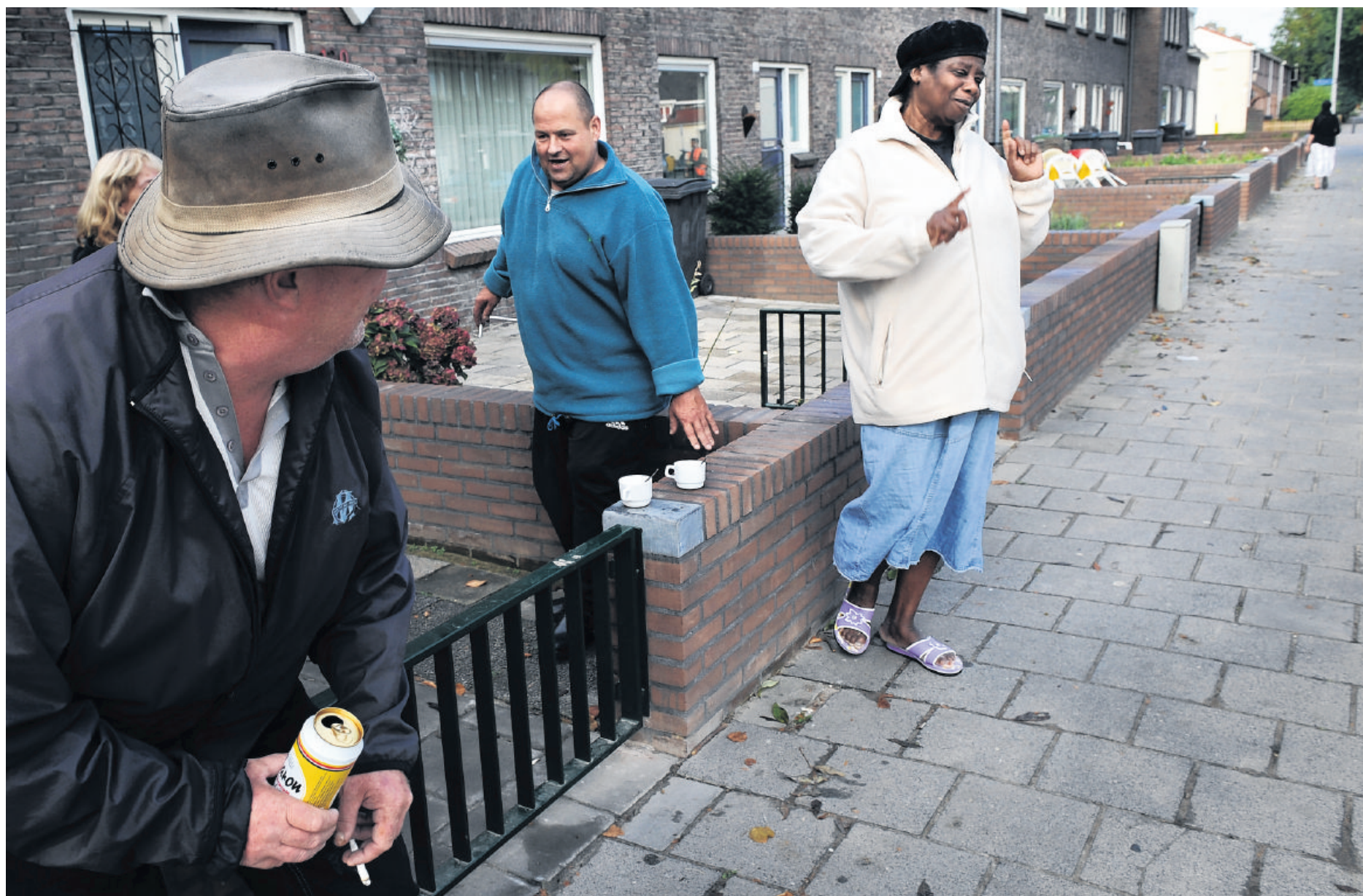
Buurtbewoners in Woensel-West bij de opgeknapte voortuinen in de Edisonstraat.

Niemand hier die daarvoor al- leen dank zegt aan het kabinet, dat